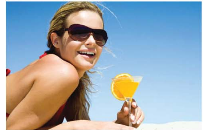
Ein Auslandssemester hat fraglos seine Reize.