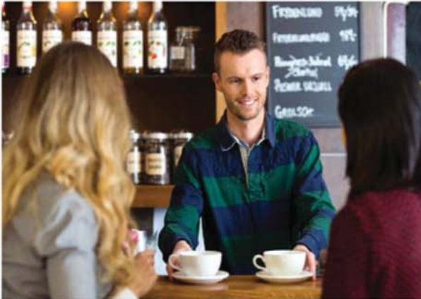
Jobben neben dem Studium her ist gut fürs Budget. Doch man sollte einiges beachten.